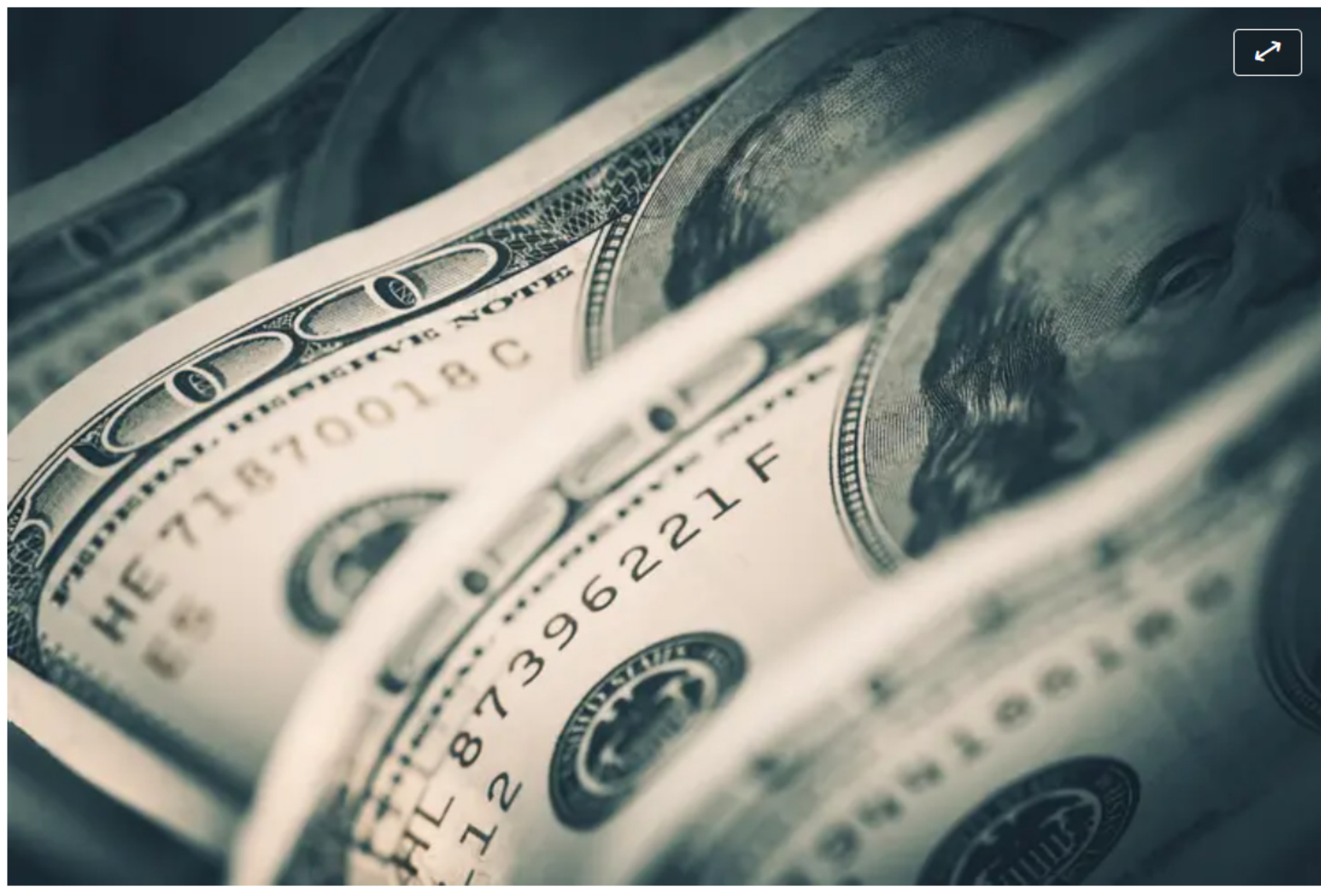
Las opciones para invertir los dólares incluyen desde fondos comunes hasta la compra de propiedades