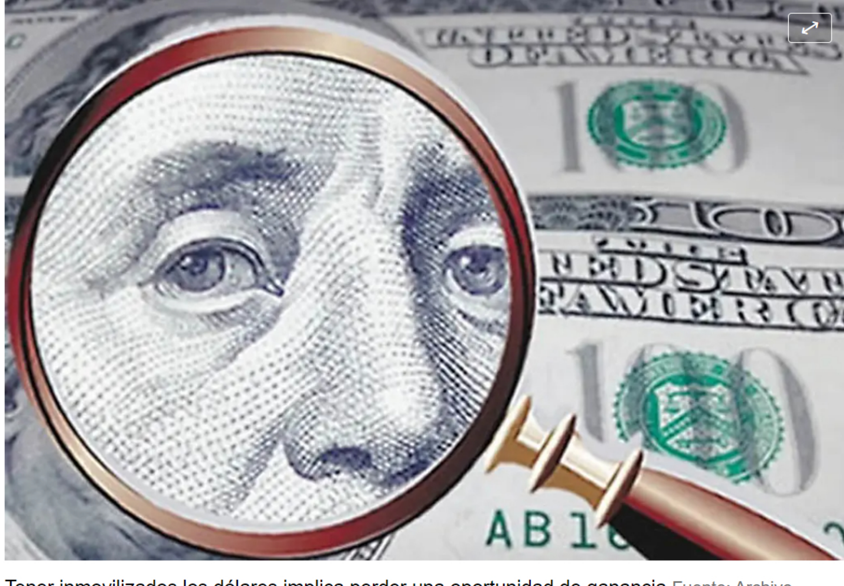
Tener inmovilizados los dólares implica perder una oportunidad de ganancia